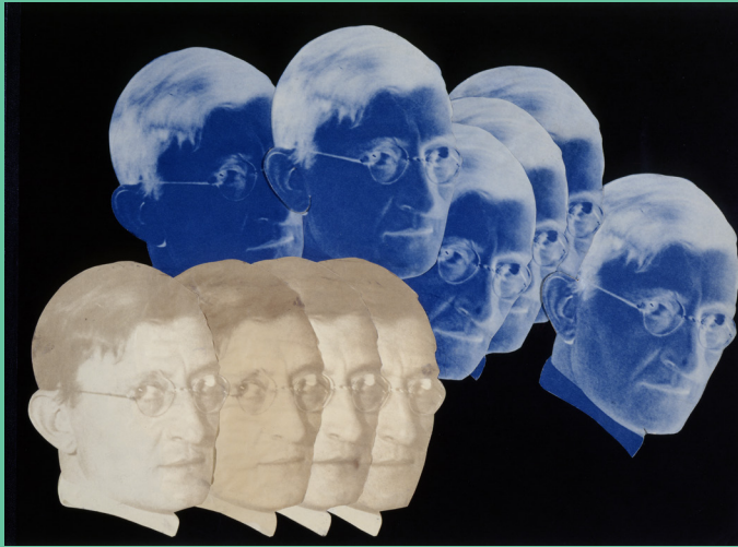
Porträt Josef Albers, Positiv-Negativ-Collage, aus »9 Jahre bauhaus. eine chronik« (Abschiedsgeschenk der Bauhäusler für Walter Gropius), 1928, Bauhaus-Archiv Berlin