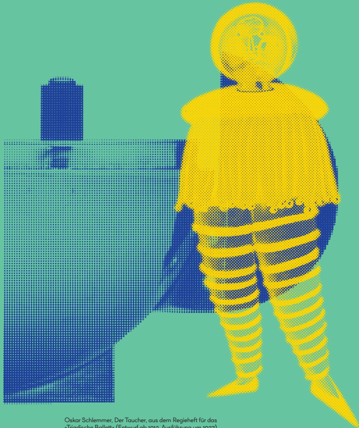
Oskar Schlemmer, Der Taucher, aus dem Regieheft für das »Trübsche Ballett« (Entwurf ab 1912, Ausführung um 1927), Bauhaus-Archiv Berlin, Marianne Brandt, Tee-Extraktkännchen, 1924, © VG Bild-Kunst Bonn/Bauhaus-Archiv Berlin, Foto: Fred Kraus

Berlinische Galerie Landesmuseum für Moderne Kunst, Fotografie und Architektur Alte Jakobstraße 124 – 128 10969 Berlin